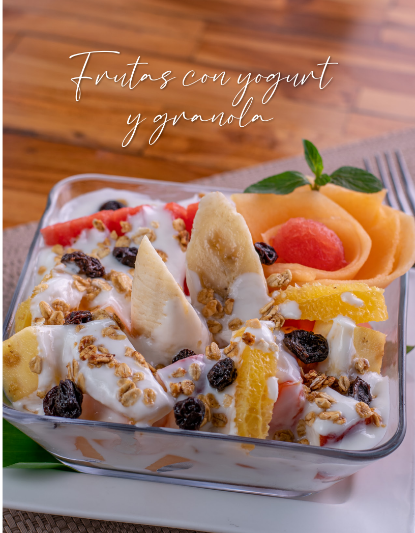
Frutas con yogurt y granola